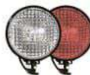
фары на СИМ